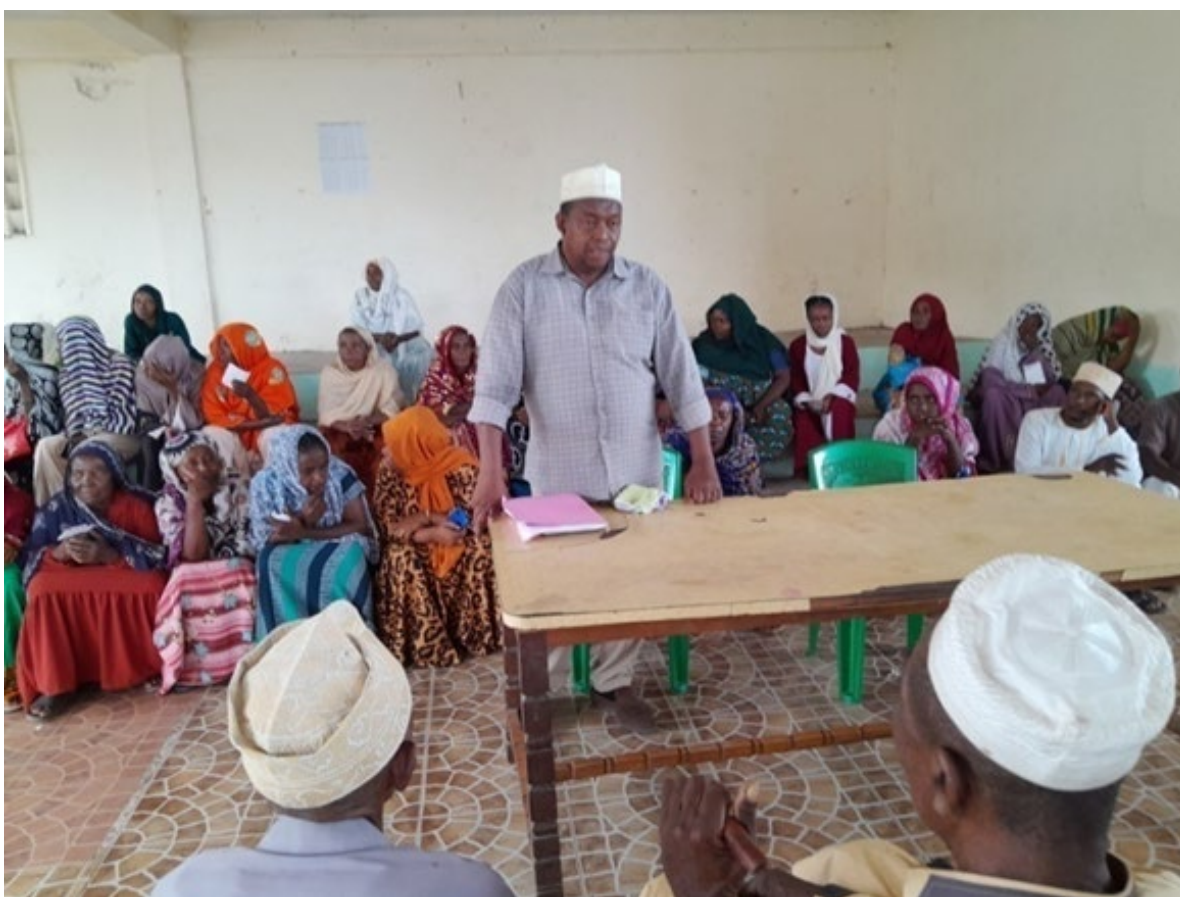
Photo illustrative de séance de validation des PAC