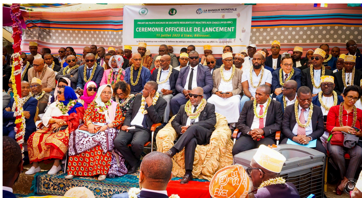
Cérémonie officielle de lancement: Sima Ndzouani, le 11 07 2023

La cérémonie a été marquée également par la présence d'une délégation de la Banque Mondiale conduite par le représentant résidant en Union des Comores.